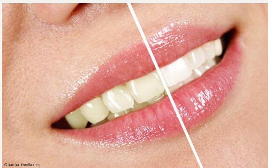
Deutlicher Unterschied: Professionelles Bleaching beim Zahnarzt wirkt!

Vertrauen Sie Ihre Zähne besser Profis an!