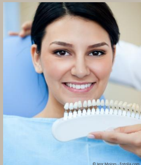
Bleaching vom Zahnarzt: Gewinnendes Lächeln mit strahlend weißen Zähnen

Dunkle Zähne können ein ziemliches Ärgernis sein: Obwohl sie sauber geputzt sind, wirken sie einfach nicht hell. Die Folge ist: Man traut sich oft nicht mehr, unbefangen zu reden und zu lächeln. Man achtet darauf, dass andere die Zähne nicht sehen. Und wenn man fotografiert wird, lässt man den Mund lieber zu. Das muss nicht sein: Zähne können heute mit bewährten Methoden wieder aufgehellt werden. Professionelles Bleaching beim Zahnarzt kostet nur wenige Hundert Euro. Aber das neue Lebensgefühl ist unbezahlbar!