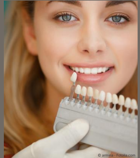
Bleaching vom Zahnarzt: Gewinnendes Lächeln mit strahlend weißen Zähnen

Dunkle Zähne können ein ziemliches Ärgernis sein: Obwohl sie sauber geputzt sind, wirken sie einfach nicht hell. Die Folge ist: Man traut sich oft nicht mehr, unbefangen zu reden und zu lächeln. Man achtet darauf, dass andere die Zähne nicht sehen. Und wenn man fotografiert wird, lässt man den Mund lieber zu. Das muss nicht sein: Zähne können heute mit bewährten Methoden wieder aufgehellt werden. Professionelles Bleaching beim Zahnarzt kostet nur wenige Hundert Euro. Aber das neue Lebensgefühl ist unbezahlbar!