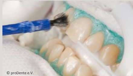
Power-Bleaching beim Zahnarzt: Auftragen des Bleaching-Gels

Wenn Sie die Praxis wieder verlassen, können Sie sich an sichtbar helleren Zähnen freuen!