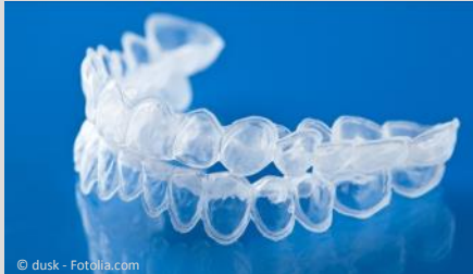
Bleaching-Form aus Kunststoff, in die Sie das Aufhellungs-Gel einfüllen.

Beim Home-Bleaching werden vom Zahnarzt dünne flexible Formen aus einem transparenten Kunststoff hergestellt, die genau auf Ihre Zähne passen (siehe Foto).